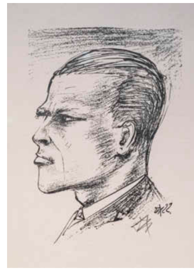
Finsterer Blick: Otto Dix in seinem Selbstporträt aus dem Jahr 1922.

Eine der Stärken der Ausstellung ist, dass sie neben den Stars wie den mehrmals vertretenen Kirchner, Kokoschka, Christian Schad (1894 bis 1982), Paul Klee (1879 bis 1940), Käthe Kollwitz