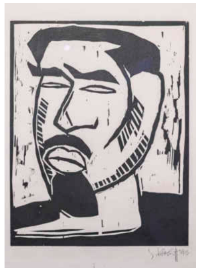
Karl Schmidt-Rottluffs Holzschnitt »Selbstbildnis« aus dem Jahr 1913.

(1867 bis 1945) und Ludwig Meidner (1884 bis 1966) auch weniger bekannte Künstlerinnen und Künstler in den Fokus rückt. Deren Arbeiten können vielfach mit den Werken ihrer berühmten Kollegen Schritt halten.