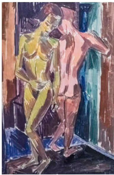
Ein Aquarell des gebürtigen Eschauers Fritz Schaeffler: Zwei Akte.

Künstler die Psychologie der Dargestellten: Das gilt exemplarisch für Otto Dix' (1891 bis 1969) Selbstporträt aus dem Jahr 1922,