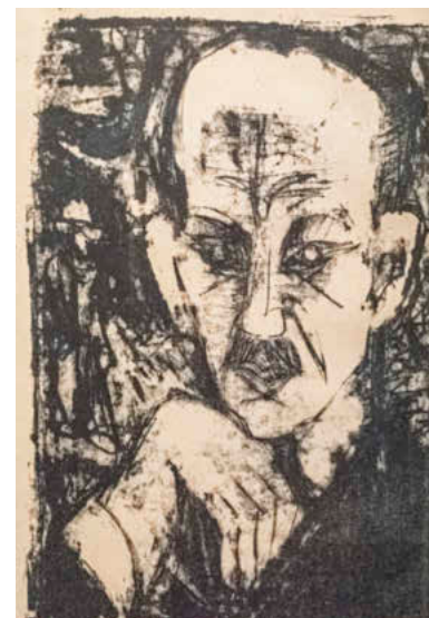
Ernst Ludwig Kirchners Bildnis des Dramatikers Carl Sternheim von 1916.